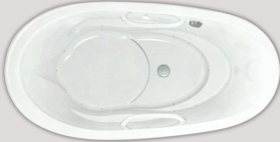
ESSENCIA OVAL 7236 (INDEPENDIENTE)